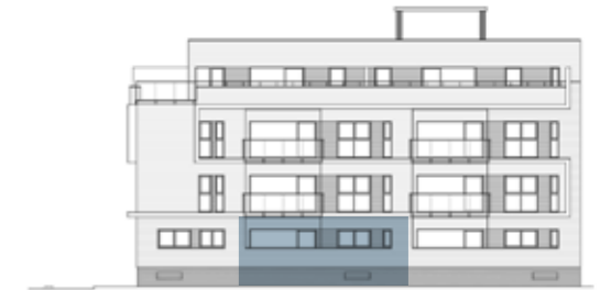
Calle Río Segura